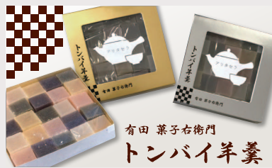
有田 菓子右衛門 トンバイ羊羹

好評いただいている小城羊羹の老舗 八頭司伝吉本舗製アリタセラオリジナルのお土産「トンバイ羊羹」を期間中、数量限定販売いたします。