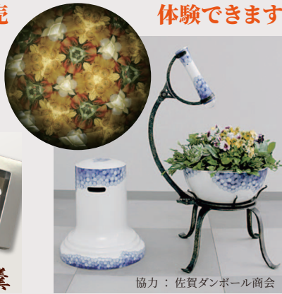
協力：佐賀ダンボール商会

「ひしぼろの製作実演」や「ひな祭りのお菓子、こだわりの嬉野茶販売」も行いますので、ご賞味ください