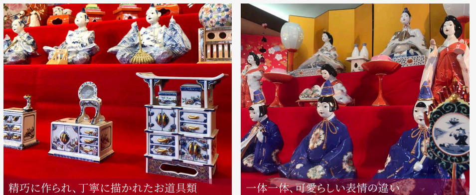
精巧に作られ、丁寧に描かれたお道具類