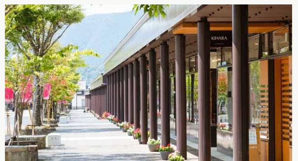
店舗の外壁や柱を塗り直してリフレッシュしたアーケード