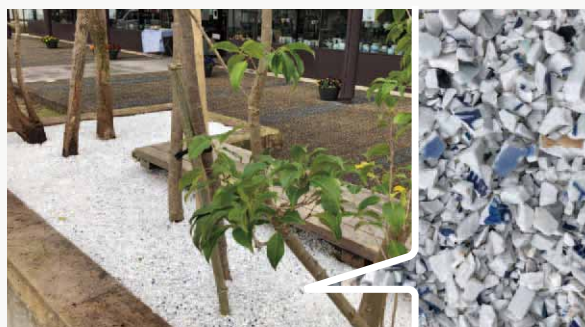
植栽の足元に、役目を終えた器を細かく砕いた「べんじゃら」を敷き詰め再利用