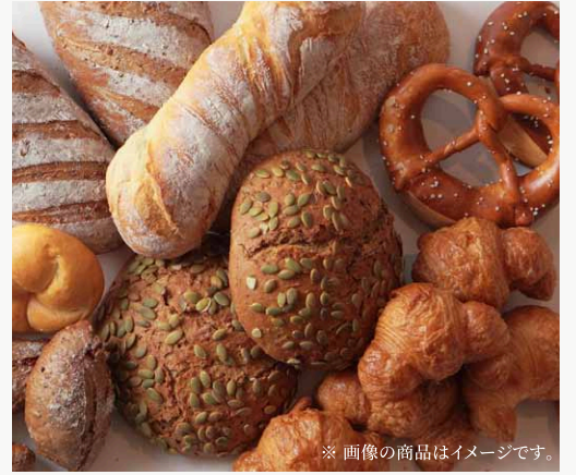
※ 画像の商品はイメージです。

アリタセラに パン屋さんがやってくる！ 人気のパン屋さんにご参加いただき、9月19日(日)アリタセラにて「パンマルシェ」を初開催いたします。有田だけでなく、佐賀、嬉野、伊万里、佐世保からも、話題のパン屋さんが勢ぞろい。ひとつひとつ丁寧に焼き上げた各店自慢のこだわりのパンをぜひご賞味ください。1日限定、なくなり次第終了の特別なイベントです。アリタセラから、美味しいパンで笑顔をお届けします。