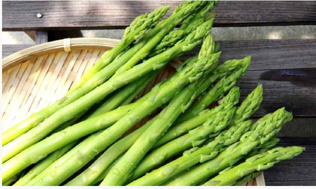
※ 画像の商品はイメージです。取り扱い商品は天候等により変更になる場合があります。