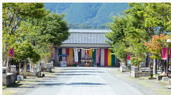
「茶わん神輿」へと向かう参道をイメージした中央大通りの石畳風舗装

歩行者と車が共用する広場的な空間を目指して舗装一新し、植栽をリニューアルした中央大通り