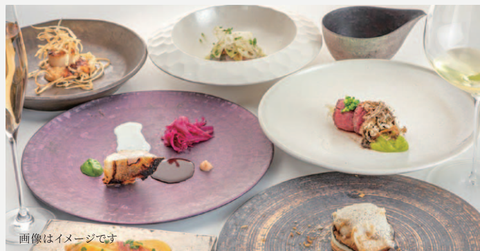
画像はイメージです クリスマスディナーのご予約・お問い合わせは arita huis まで。 TEL : 0955-25-8018 E-MAIL : info@aritahuis.com

アリタセラ中央大通りの街路樹を中心に、総延長350mにおよぶ光の演出を楽しめる「ウィンター・イルミネーション」は、アリタセラの冬の風物詩。 クリスマス前に、早めに有田にやってきたサンタクロースたちとのコラボレーションも必見です。アリタセラ敷地内に何体のサンタがいるかぜひ探してみてください。 店舗の屋根に登って日向ぼっこしたり、風に飛ばされないように木にしがみついたり星を眺めたり、思い思いに過ごすサンタを探しながら、夜のショーウィンドウをぶらり散歩するのもおすすめです。 arita huisでは、12月23日(水)、24日(木)、25日(金)の3日間、クリスマス限定のディナーコース(要予約)をご用意していますので、イルミネーションで彩られたアリタセラの夜景を見ながら、親しい方との楽しいひとときをお過ごしいただけます。