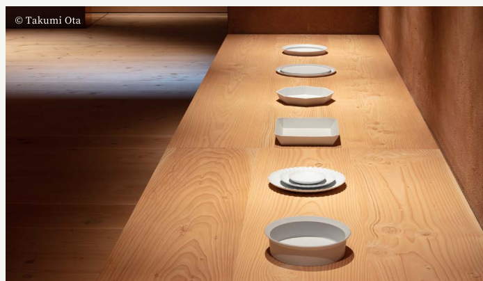
百田陶園 TEL 0955-42-2519 / https://1616arita.jp/

店舗改装のため昨年秋より営業を休止しておりました百田陶園本社ショールームが、このたびオリジナルブランド「1616/arita japan」に特化したショールームとして、リニューアルオープンしました。 リビング、キッチン、バスルームなど、暮らしをイメージさせる広々とした贅沢な空間には、厳選された家具や雑貨とともに器が並び、まるでギャラリーのような設えです。有田焼の原料である陶石を加えた左官仕上げの土壁や天井にもご注目ください。 店内にはカフェを併設しており、本格的なエスプレッソマシンで入れたカプチーノやカフェラテを、ショールームのお好きな場所でも思い思いにお楽しみいただけます。 アリタセラにご来場の際は、ぜひ訪れていただきたい話題のスポットの誕生です。