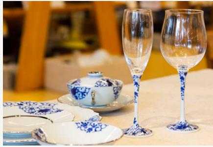
東洋セラミックス @toyo_ceramics