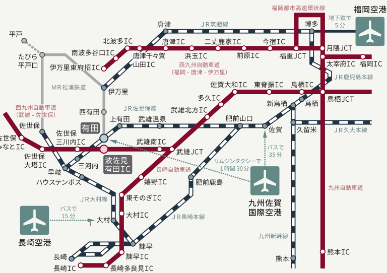
車でお越しの場合